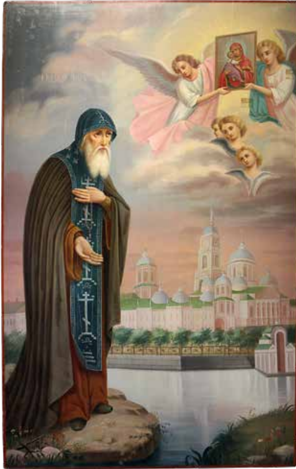
Преподобный Нил Столобенский. 1909 г. Н. Клейн

опыт коллег-современников специалисты, предпочитавшие творить в разных живописных манерах и при этом опиравшиеся на глубочайшие пласты отечественной изобразительной культуры. «Ближе всего в их среде к языку древней иконы, как считается, подошел иконописец из-под Боровска Николай Емельянов. Но по его “Благовещению” и “Господу Вседержителю” прекрасно заметно: старинные иконописные приемы он стилизует на новый лад, свободно подходит к колористической гамме и композиционному решению своих икон», — характеризует его творчество Комашко.